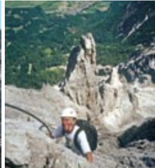
▲ Ostansicht des Grates von den Sandspitzen bis zum Kl. Laserkopf ▲ Bilder von der Gipfelwand der Gr. Sandspitze ▲